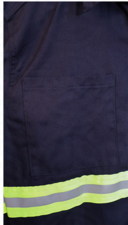
Bolsa lateral superior